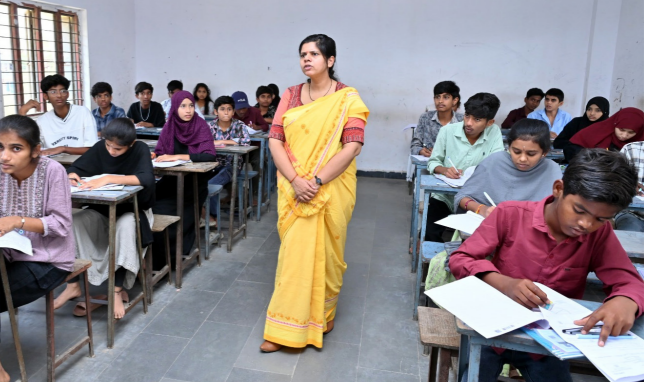
లేకుండా.. విద్యార్థులు ఒత్తిడికి లోనుకాకుండా ప్రశాంత వాతావరణంలో పరీక్షలు రాసేలా చర్యలు తీసుకోవాలన్నారు. సీసీ కెమెరా రికార్డింగ్ నడుమ ప్రశ్నాపత్రాల సీక్రెట్ రిచార్జి లేదా అని తనిఖీ చేశారు. కలెక్టర్ వెంట పరీక్షా కేంద్రం చివ్ సూపరింటెండెంట్ మంగళ ఉన్నారు.

అక్షర టుడే, నిజామాబాద్ సీటీ: విద్యార్థులకు పరీక్ష కేంద్రాల్లో అన్ని సౌకర్యాలు కల్పించాలని కలెక్టర్ ఇలా తిపాతి ఆదేశించారు. ఈ మేరకు గురువారం బోధన పట్టణంలోని విద్యా వికాస్ జూనియర్ కళాశాలలో పదో తరగతి పరీక్ష కేంద్రాన్ని తనిఖీ చేశారు. పరీక్ష కేంద్రంలోని ఆయా తరగతి గదులను సందర్శించారు. పరీక్షల నిర్వహణ సరళిని కలెక్టర్ పరిశీలించారు. విధులు నిర్వహిస్తున్న అధికారులు, సిబ్బందితో ఎంపికైన సెల్ ఫోన్లు తెచ్చారు అని ఆరా తీశారు. ఎట్టి పరిస్థితుల్లోనూ సెల్ ఫోన్లు తేకూడదని.. కట్టుబట్టమైన పర్యవేక్షణ జరపాలని నిర్దేశించారు ఆదేశించారు. ప్రత్యేక కేంద్రాల్లో విద్యార్థులకు అవసరమైన తాగునీరు, ప్రభుత్వ చికిత్స, ఓ.ఆర్.ఎస్. ప్యాకెట్లు అందుబాటులో ఉంచాలన్నారు. తరగతి గదిలో తగిన వెంటిలేషన్ ఉండేలా చర్యలు తీసుకోవాలన్నారు. ఎక్కడ ఎలాంటి చిన్న తప్పిదాని అవకాశం ఇవ్వకుండా పరీక్షలు నిర్వహించాలని కలెక్టర్ సూచించారు. ఎక్కడ కాసియంగ్ గా ఆస్పాతం