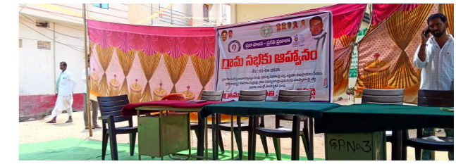
నార్సు, ప్రభుత్వ కార్యక్రమమైన గ్రామసభను ఇంత నిర్లక్ష్యంగా నిర్వహించడం సరైన విధానం కాదని వారన్నారు. తీర్మానం అధికారులు 12.30 రావడంపై వారు ఆగ్రహించారు.

గ్రామసభపై అధికారుల నిర్లక్ష్యం అక్షర టుడే, బాన్సువాడ: బీరూర్ మండలంలోని బరంగ్ గిట్ల గ్రామంలో గ్రామసభ గురువారం ఉదయం 11 గంటలకు ప్రారంభం కావాల్సి ఉండగా 12.30 దాటింది. ప్రజాప్రతినిధులు ఆగ్రహం వ్యక్తం చేశారు. గ్రామసభకు సంబంధించి ముందుగా సమాచారం ఇచ్చిన సేవకుండా సభకు ప్రారంభం చేయడంపై ఆగ్రహం వ్యక్తం చేశారు. అయితే సంబంధిత అధికారులు, ప్రజాప్రతినిధులు అలసటగా రావడం.. సభను ప్రారంభించకపోవడంపై వారు తీవ్ర ఆసంతృప్తి వ్యక్తం చేస్తున్నారు.