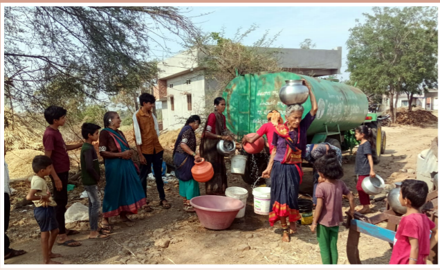
తండాల్లో తాగునీటి కష్టాలు..