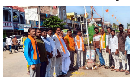
గాంధారి మండల కేంద్రంలో..