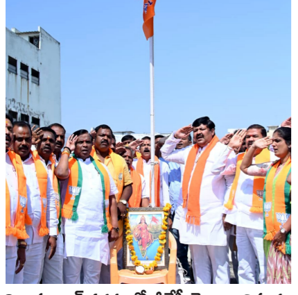
నిజామాబాద్ నగరంలో బీజేపీ జెండా ఆవిష్కరణ

బీజేపీ ఆవిర్భావ దినోత్సవాన్ని ఉమ్మడి జిల్లాలో మనంగా నిర్వహించారు. నాయకులు తమ ప్రాంతాల్లో జెండాలు ఎగురవేశారు. అనంతరం వారు మాట్లాడుతూ.. నాడు రెండు పార్టీలతో స్థానాల నుంచి ప్రారంభం అయిన పార్టీ నేడు ఈ స్థాయికి ఎదిగిందన్నారు. ప్రపంచంలోనే అతి పెద్దపార్టీగా అవతరించిందన్నారు. ప్రధాని మోదీ సారథ్యంలో దేశం అర్ధరంగాల్లో ముందుకు వెళ్తుందన్నారు. - అక్షరటుడే, నెట్ వర్క్