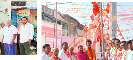
ఆర్వూర్ పట్టణంలోని 12వ వార్డులో..