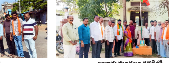
అలూరు మండలం కల్లెడిలో..