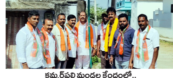
కమ్మర్ పల్లి మండల కేంద్రంలో..

బీజేపీ ఆవిర్భావ దినోత్సవాన్ని ఉమ్మడి జిల్లాలో మనంగా నిర్వహించారు. నాయకులు తమ ప్రాంతాల్లో జెండాలు ఎగురవేశారు. అనంతరం వారు మాట్లాడుతూ.. నాడు రెండు పార్టీలతో స్థానాల నుంచి ప్రారంభం అయిన పార్టీ నేడు ఈ స్థాయికి ఎదిగిందన్నారు. ప్రపంచంలోనే అతి పెద్దపార్టీగా అవతరించిందన్నారు. ప్రధాని మోదీ సారథ్యంలో దేశం అర్ధరంగాల్లో ముందుకు వెళ్తుందన్నారు. - అక్షరటుడే, నెట్ వర్క్