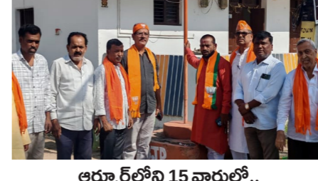
అర్వూర్ లోని 15 వార్డులో..