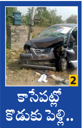
కాసేపట్లో కొడుకు వెళ్లి..