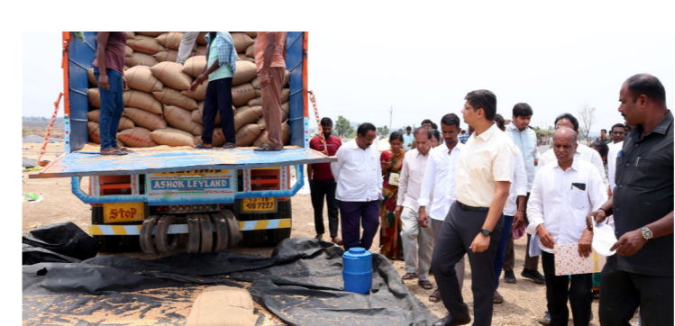
ఆదేశించారు. కాంటా వేసి ధాన్యాన్ని వెంటనే గోదాములు, మిల్లులకు తరలించాలన్నారు. ఆఫ్ఫీస్ పీఎస్.ఎస్. కేంద్రంలో లారీ లోడింగ్ ను కలెక్టర్ పరిశీలించారు. ట్యాబ్ ఎంట్రీలు వేగవంతం చేయాలని, వర్షా వల్ల నష్టం జరగకుండా ధాన్యం భద్రపరచాలని మార్కెట్ డి.ఎం, ఇతర అధికారులకు సూచించారు.