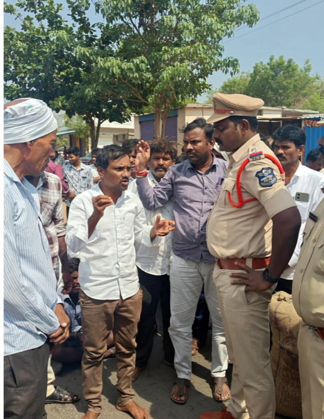
■ ధాన్యం కొనుగోలు