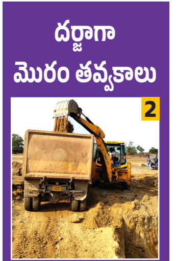
దర్జాగా మొరం తవ్వకాలు