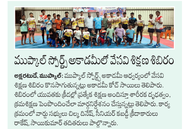
ముప్పాల్ స్పోర్ట్స్ అకాడమీలో వేసవి శిక్షణ శిబిరం