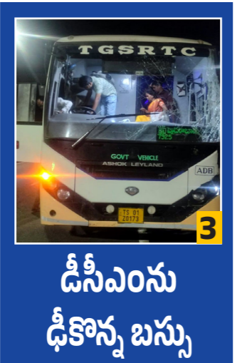
డీసీఎంను ఢీకొన్న బస్సు