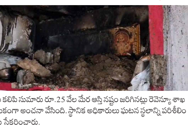
ఇళ్లకు కలిపి సుమారు రూ.25 వేల మేర అగ్ని నష్టం జరిగినట్లు రెవెన్యూ శాఖ ప్రాథమికంగా అంచనా వేసింది. స్థానిక అధికారులు ఘటన స్థలాన్ని పరిశీలించి వివరాలు సేకరించారు.